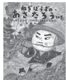
ねぎぼうずのあさたろう その7 飯野和好/福音館書店