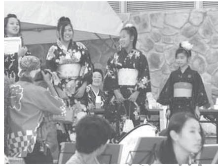
「ゆかたコンテスト」の様子