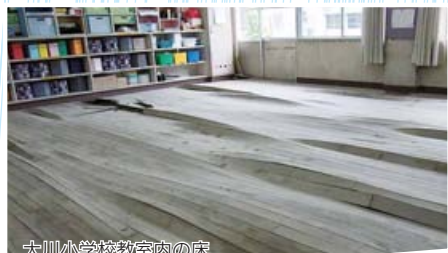
大川小学校教室内の床