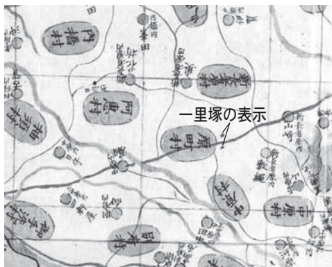
【図1】絵図にある原町の一里塚の様子 絵図年代不詳「筑前国各郡国繪屋六」

道には、往来者へ分かるように距離を表す表示板や案内板を掲げています。これは現在も昔も同じです。江戸時代の慶長十二（一六〇五）年、幕府が提出させた筑前国の国絵図には、主だった街道に53か所の一里塚が確認でき、慶長の末ごろまでには、領国の街道を整備していたことが分かっています。