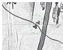
【図2】道を挟むようにあった一里塚 絵図年代不詳「筑前国郡絵図表精屋郡・裏精屋郡」

一里塚は、国境又は次の町や村までの距離を表す起点となっており、篠栗街道でも飯塚に至るまでに5か所の塚が置かれていたようです。