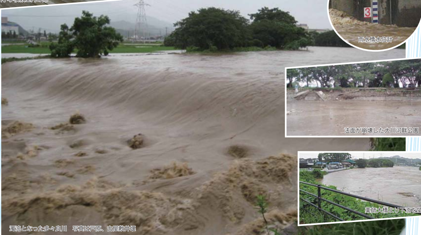
濁流となった多々良川 写真は戸原、古屋敷井堰