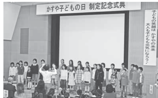
昨年度は「粕屋こどもコーラス隊」の皆さんが、すばらしい歌声を聞かせてくれました。

「かすや子どもの日」にふさわしい内容であれば応募できます。(合唱、楽器演奏、ダンスなどジャンルは問いません)