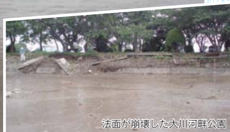
法面が崩壊した大川河畔公園