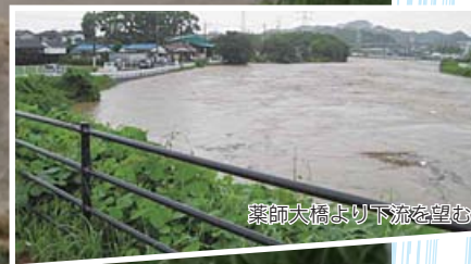
薬師大橋より下流を望む