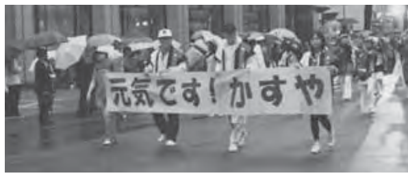
みんなで心ひとつに、想いひとつに踊りました。