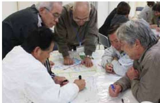
△災害図上訓練の様子

講演会終了後には、小学校区ごとに地域防災マップ作成に向けた日程を決め、11月11日(金)に粕屋西小学校区、14日(月)に仲原小学校区及び粕屋中央小学校区、28日(月)に大川小学校区