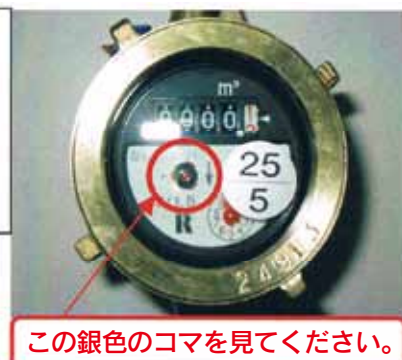
この銀色のコマを見てください。