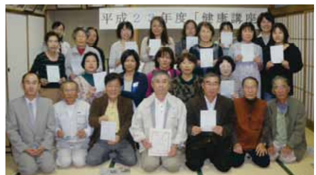
▲柚須区のみなさん 19名の方が完歩を達成されました