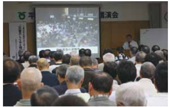
△防災講演会の様子

しまったのか」「地震直後の避難行動の分析と対策」など、大きな災害ほど自主防災組織が大きな力となることを分かりやすく話され、地震発生時の建物の揺れ方や室内の様子を動画を使って解説されました。