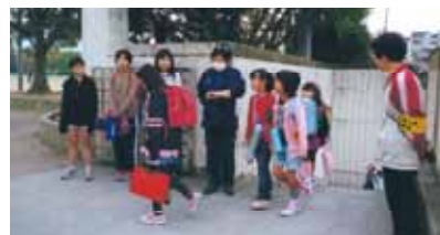
朝のあいさつ運動、地域や学校あいさつの輪が広がっています。

粕屋町婦人会は「自ら考え、自ら行い、創造する婦人会」として、これからも楽しく活動してまいります。