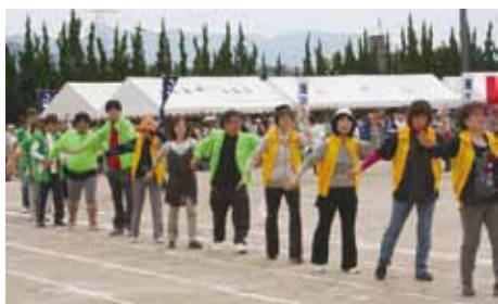
「心豊かなふるさと粕屋」を目指して会場にできた輪

第1回粕屋町民運動会以来、踊りや仮装行列など、楽しく参加しています。昨年も、町長さんはじめ、ご来賓の方々、健康かすや21のメンバー、各種団体、会場の皆さん、和太鼓愛好会「雅」の打ち鳴らす和太鼓とともに粕屋町民音頭を踊りました。楽しいときを共有できたことに感謝いたします。