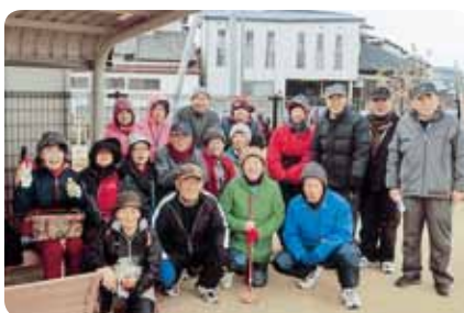
長者原下区ふくよか会 グラウンドゴルフ (1月18日)

私達のクラブは、「長者原下区福寿会」と称し、95才の方を筆頭に現在71名の会員で構成しています。