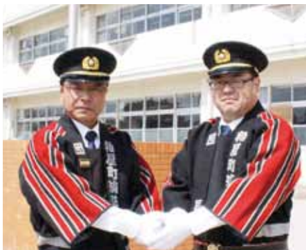
退団された因団長(左)と就任された御手洗新団長(右)

退団された皆さん、長い間本当にお疲れさまでした。また、新入団員の皆さん、先輩方に負けないように、「自分たちの地域は自分たちで守る」という強い気概を持って、しっかりとがんばってください。