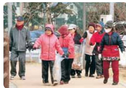
長者原下区ふくよか会 阿恵大池公園環境美化作業

毎月1回の定例役員会では、老く連理事会の報告、今後の福寿会の行事の説明や確認を行っています。会員には、「福寿会だより」を毎月発行し、福寿会や老く連、長者原下区や町の主な行事や連絡事項等も掲