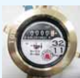
水道メーター写真