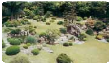
国指定名勝に指定 伊藤邸の庭園 「NHKの朝ドラに描かれた伝右衛門はちょっと違う。本物はもっとよかった。」と少し悔しそうなガイドさん。郷土の産業・文化の発展に尽くした伝右衛門さんは、郷土の誇りだそうです。

旧伊藤伝右衛門邸(飯塚市) 石炭・歴史博物館&石炭記念公園(田川市)を巡りました。