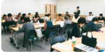
職員より施設の説明

施設概要や作業内容について説明を受け所内を見学しました。今後の活動の参考にしたと思います。