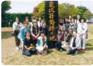
石炭・歴史博物館にて