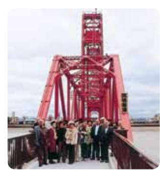
大川市筑後川昇開橋

じく国指定重要文化財である筑後川昇開橋を見学しました。ここは、昭和10年に筑後川を跨ぎ竣工された旧国鉄佐賀線の鉄橋で、大型の船舶が容易に運行できるように可動橋として架設されたものです。国鉄が廃止になった現在は遊歩道として生まれ変わり、地元や観光客に親しまれています。