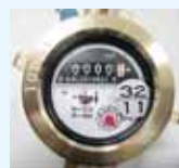
水道メーター写真