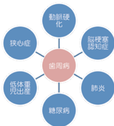
歯周病の全身への影響

歯周病の怖いところは歯周病菌が歯ぐきの炎症部位の血管から血液中に入りこみ、口の中だけではなく全身の健康にも悪い影響を及ぼすということです。