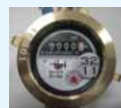
水道メーター写真