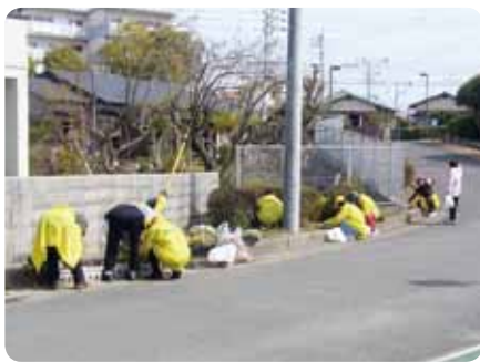
4月 みんなで美化活動