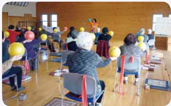
粕屋転ばん体操で足腰元気に

※ ゆうゆうサロンの見学・1日体験の申込み希望者は、参加希望日の2日前までに下記までご連絡ください。