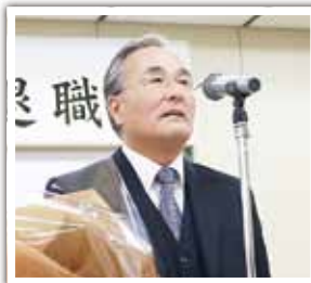
退任された大塚教育長