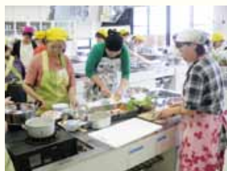
マタニティ料理教室の風景