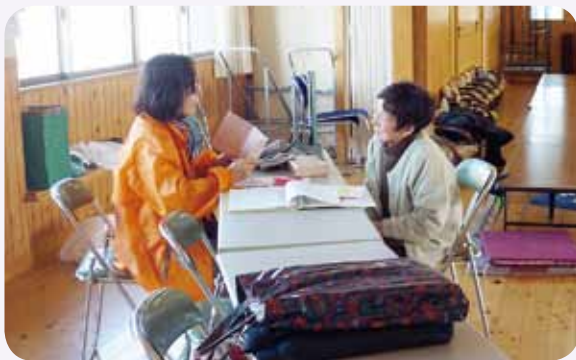
血圧測定などにより、体調を確認