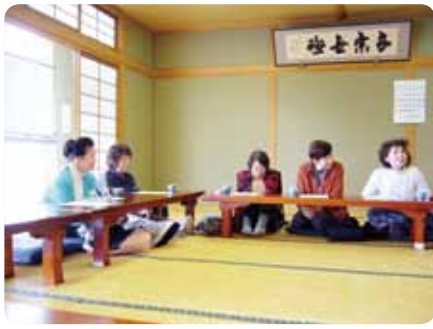
活発な活動の紹介に共感して

その後、粕屋町社会福祉協議会に福祉委員の体制が整備された際に、友愛訪問ボランティア活動を続けていく必要があるかという提起がありました。しかし、民生児童委員