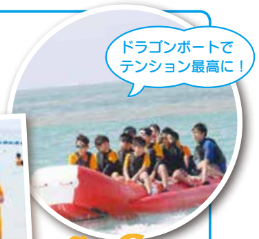
ドラゴンボートでテンション最高に!