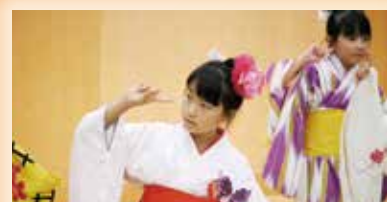
③日本舞踊 優雅な舞を披露 しました