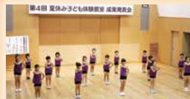
⑥バトン 元気いっぱい披露 しました