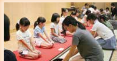
⑨茶道 お茶のほか、礼につ いてもしっかりと学びました