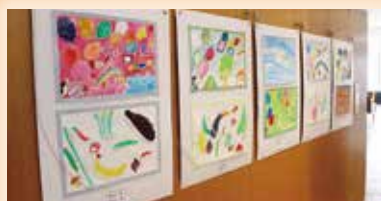
⑤会場展示 会場には絵画、 ちぎり絵、トンボ玉を展示しました