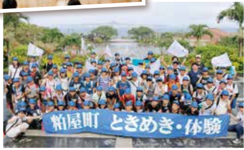
美ら海水族館に到着