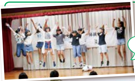
夜の祭りは大成功!