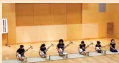
②三味線 大勢の前でも緊張 せずに演奏できました