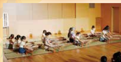
①お琴 短期間で一曲通して 覚えました

発表会では、作品展示と発表が行われ、お父さんやお母さんが見守る中、10日間という限られた時間の中で子どもたちが熱心に取り組んだ成果が発表されました。お琴に舞踊に太鼓など、どれも伝わってくるのは一生懸命な気持ち。子どもたちは肌で文化を体験することができたようです。