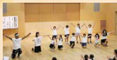
④ダンス 先生と一緒に楽し くダンス☆