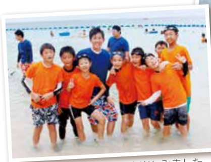
班員みんなで沖縄の海を楽しみました

2 日目最初のイベントはみんながわくわく楽しみにしていた海洋研修。朝のつどいを終えて、朝ご飯を食べたら残波ビーチへいざ出発。ドラゴンボート、シュノーケリング、海水浴とみんなで沖縄の海を一杯体験しました。昼ごはんのカレーを食べて、きれいな海をバックに集合写真を撮りました。班員と楽しんだ沖縄の海は最高の思い出になりました。夕方からは渡慶次区でエイサー交流会。沖縄の子どもたちと一緒にご飯を食べて、一緒にエイサーを体験し、最後はみんなでレク