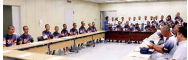
出場成績報告の様子

九州大会では1回戦での三和(熊本)に敗れてしまいましたが、抜群のチームワークで最後まで粘りました。今大会の教訓を糧に、今後も練習を続けていくとのこと。