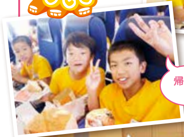
痛りの飛行機でもみんな元気!