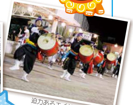
迫力あるエイサーを体験