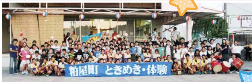
エイサー交流で沖縄の子どもたちと友達になりました