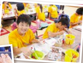
シーサーの絵付け体験☆