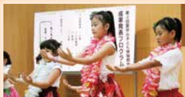
⑧フラダンス 一曲通して 踊ることができました♪