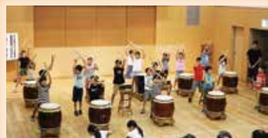
⑦太鼓 力強く最後まで叩き 抜きました