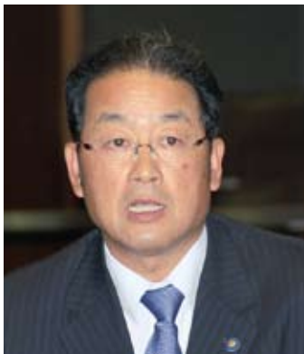
山脇 秀隆 議員