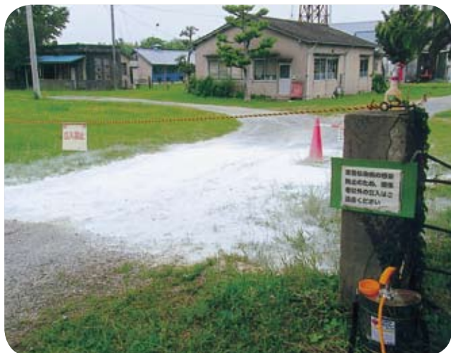
九大農場畜舎入口(消石灰散布)

検討して頂いています。②機械組合の設立時また、耕作面積増加時が補助金交付の対象です。③粕屋町では口蹄疫防疫対策本部が県の指導で6月18日立ち上げられました。