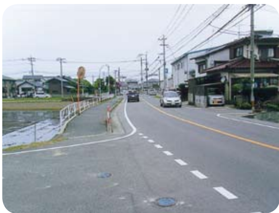
仲原十原交差点付近

粕屋町においても都市計画道路全線について、将来交通量の予測や計画道路の代替路線の有無など路線ごとにカルテを作成し廃止もしくは変更について検証をしています。 今後、地元の同意を求めながら、見直し作業を進めます。