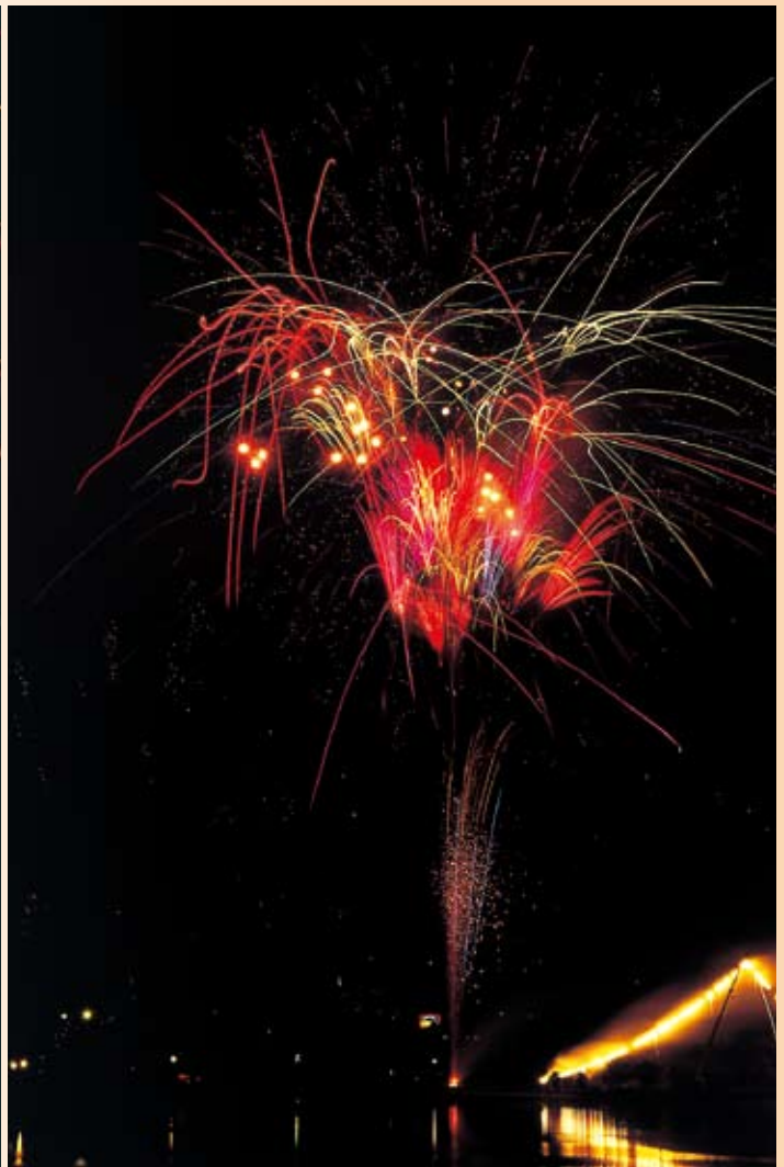
駕与丁公園の四季「花火」