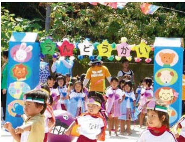
保育園うんどうかい

設整備基金2億9千万円を計画的に使って抜本的な待機児解消を求めます。中央保育所は建て替えるときに定数を増やして待機児解消をし、民営化も視野に入れて、町の単独事業で出来るか、財政状況も勘案しながらやりたい。