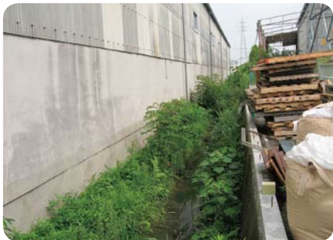
乙仲原西区の川崎地区用水路

美化作業時などの予算確保に努力します。また、美化作業に参加してもらえよう広報などでPRし推進します。