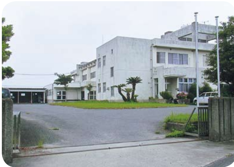
老朽化した給食センター

います。今年度は仲原小学校の6教室・大川保育所の、大川学童保育所をやり、来年度は中央小学校、その次に給食センターの建て替えと考えています。町長にお願いしていいこうと思っています。