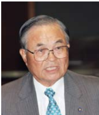
伊藤 正 議員