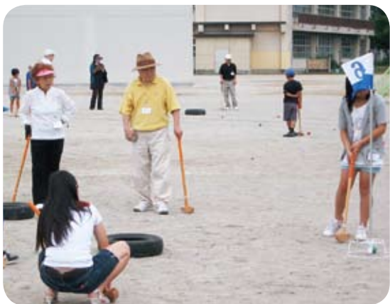
乙仲原西区グランドゴルフ大会

乙仲原西区は「四軒屋児童遊園」・「乙仲原西子ども広場」が、他用途に利用され公園や子ども