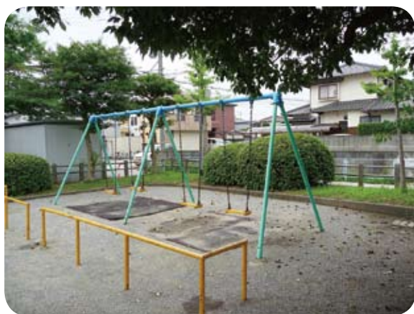
草が生えている大池公園

地域の公園等はボランティアの力をお願ひしたいし行政としても輪を広げていきバックアップしていきます。