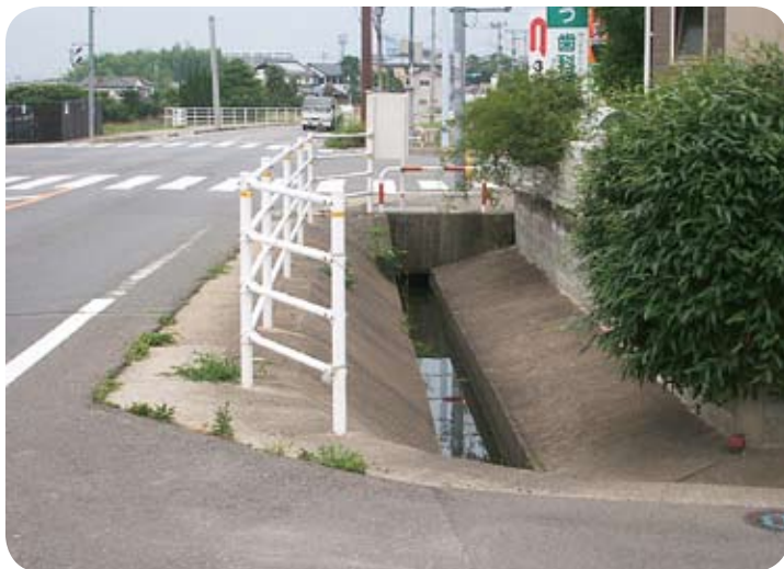
酒殿丸の内交差点付近

生活道路及び通学路の安全確保については、危険箇所の解消を第一に考えて順次整備を進めていきます。