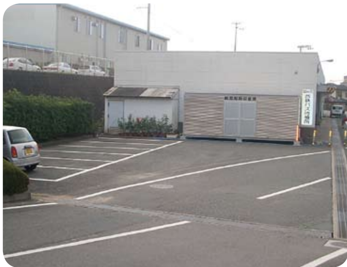
洗車場設置要望の場所(役場内)