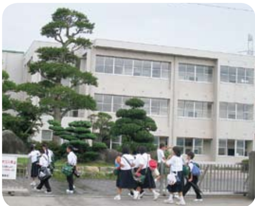
柏屋東中学校の登校風景