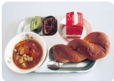
子どもたちが毎日楽しみにしている給食