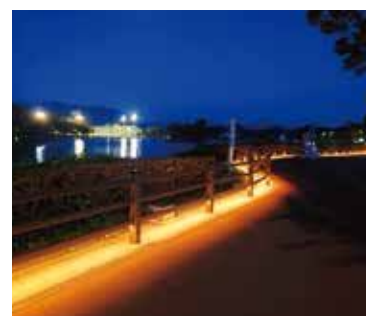
粕屋町のランドマーク駕与丁公園

町長 企業との積極的な情報交換・交流は大事。福岡を代表する企業が交流会を設け、いろんな勉強や研究をしている場にも職員を出して人的交流を図っている。それが今後知識を得たり、いろんな研究をするためのコネクションになると思う。