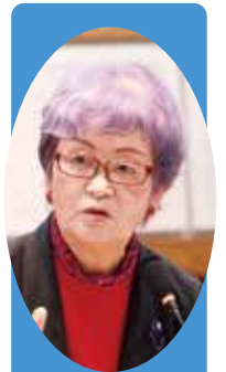
ほんだ よしえ 本田 芳枝 議員

案としては非常に面白い。よ り一層アピールする点では非常 に有益と思うが、費用対効果の 検討や様々な規制のクリアは問 題として残っている。一挙に解決 するのがライドシェアと思う。公 共の費用が要らない、税金の投 入が必要ない総合的な観点から、 検討課題とする。