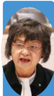
みやざき ひろこ 宮崎 広子 議員