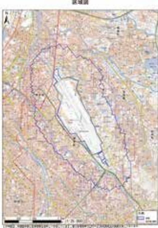
内閣府公表「福岡空港周囲の注視区域図」