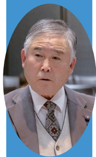
川口 晃 議員