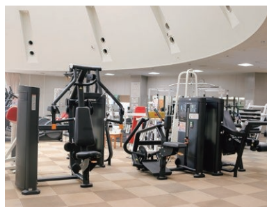
かすやドーム トレーニング室