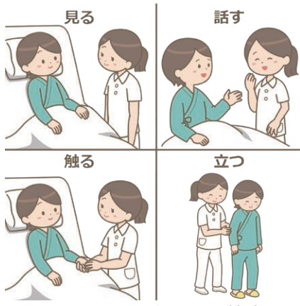
ユマニチュードの4つの技法

うことを大切にし、ケアを受ける人の「人間らしさ」を尊重するものと認識している。 認知症サポーター講座では、認知症の症状や接し方、関わる側の心構えなど、認知症の方の尊厳を大切にしたいユマニチュードの考え方に通じる内容になっている。今後、さらにみんなが支え合う地域づくりを目指し、ユマニチュードの研修や動画紹介も含め、さまざまな方法を調査し、工夫していきたい。