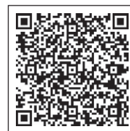
議会だより No.174 秋号

そこで、議会は、「町民主体による町民のための新しいまちづくり」を進めるための総合計画となるよう、「総合計画と総合計画策定条例の在り方について」の研修会を行いました。